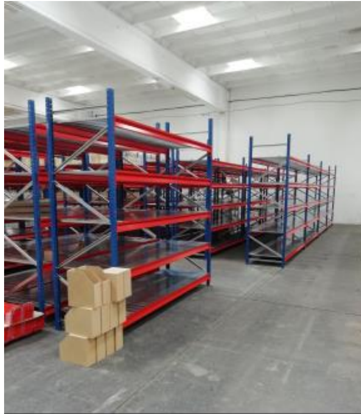
Imagen de los Racks solicitados

Corresponde al expediente N° EX-2024-6386160-GDEBA-DPTAAARBA